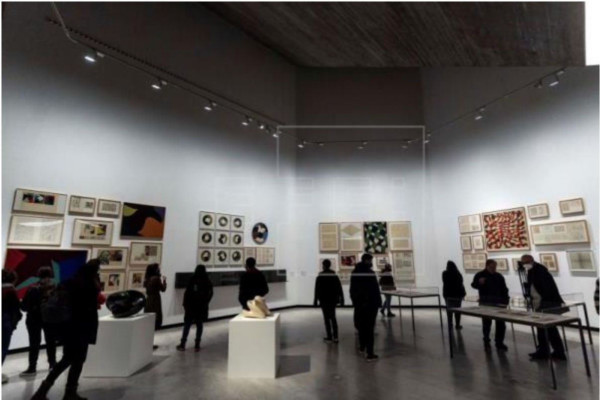
Vista general de la exposición sobre Equipo 57 presentada en el Centro de Creación Contemporánea de Andalucía (C3A) de Córdoba.