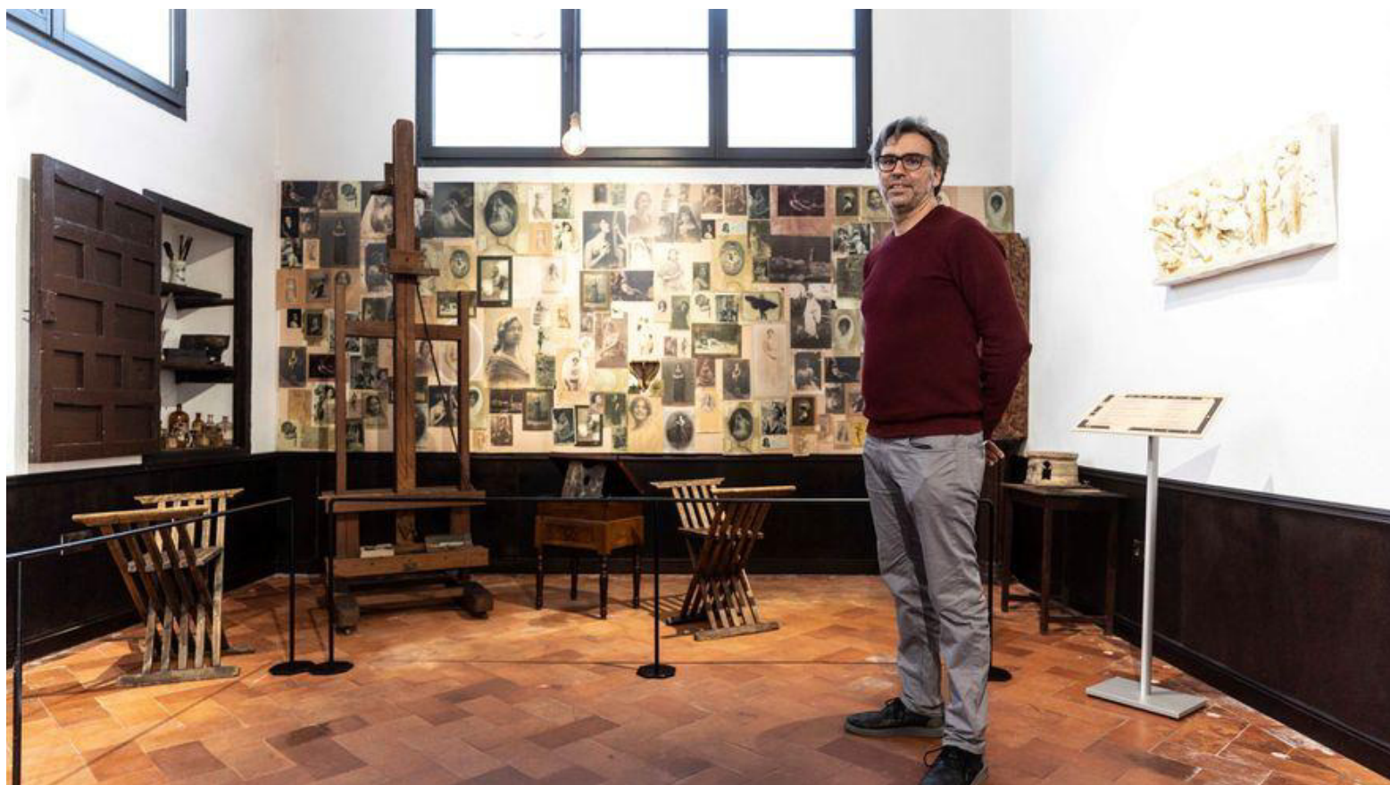
La deuda pendiente de Córdoba con los Romero de Torres