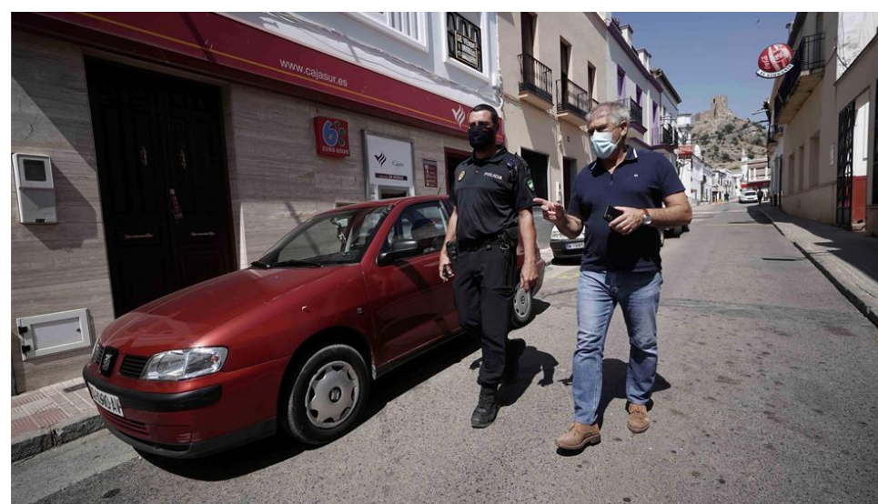
El alcalde, José Porrás, con un policía, en Belmez.

Para personas que tengan dificultades económicas para su abono, siempre que no se trate de infracciones muy graves y buscando la "reeducación de la persona infractora"