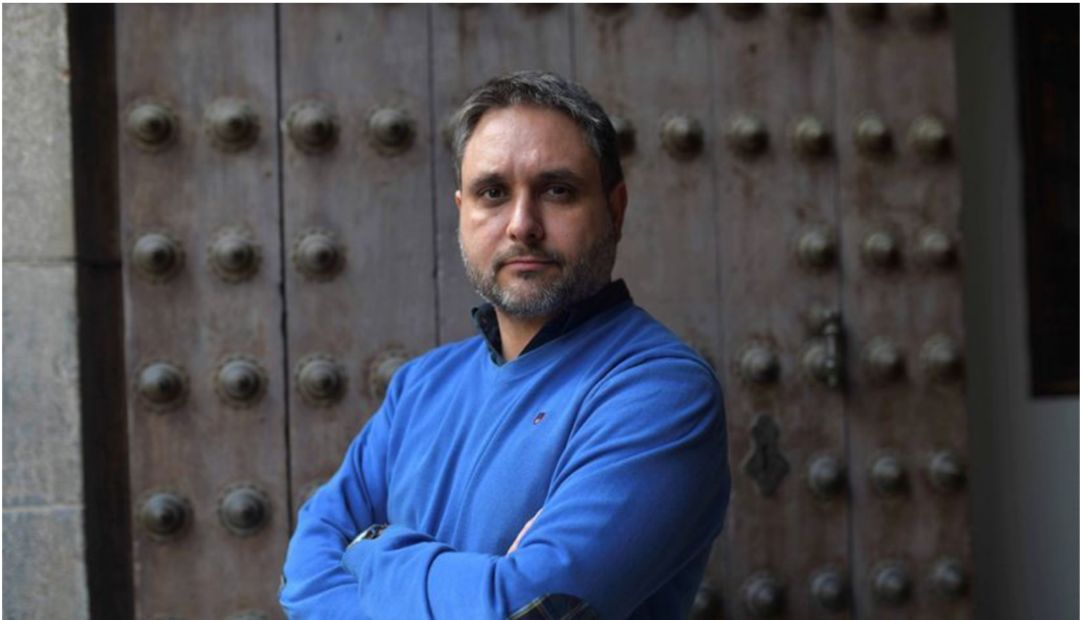
CÓRDOBA, 06/12/2019.- El profesor de Filosofía de la Universidad de Córdoba durante una entrevista con la agencia Efe con motivo de la publicación de su libro "La posverdad a debate".

Diciembre 6, 2019 Escrito por Álvaro Vega Publicado en Cultura