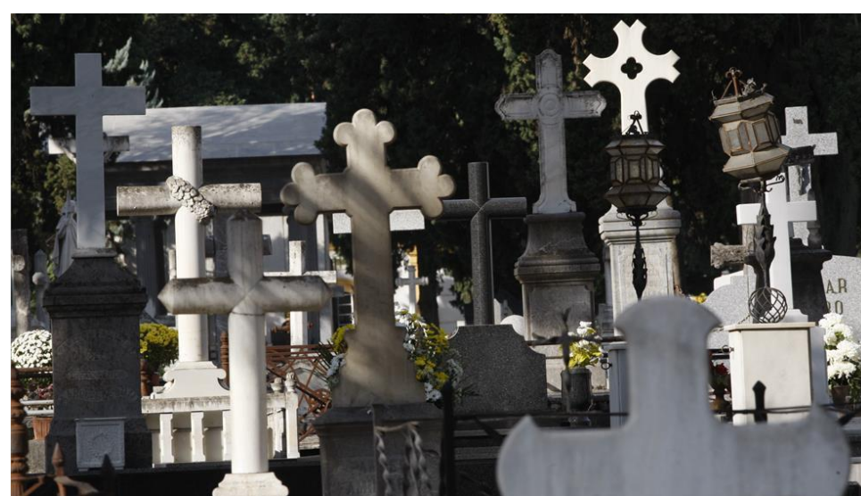
Cementerio de La Salud.

Una tesis doctoral presentada en la UCO ha localizado en la provincia diecinueve enclaves que pueden ser objeto de esta actividad