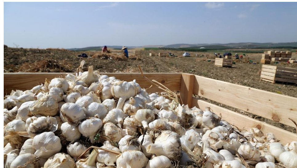
Ajos de Montalbán, en una imagen de archivo. - CÓRDOBA

El cierre de fronteras y los problemas en el transporte por la crisis sanitaria dificultan la campaña, que debe comenzar en un mes