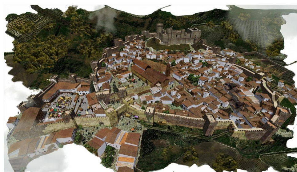
Imagen cedida a Efe por Manuel Cabezas Expósito. Reconstrucción virtual de la villa y el castillo de Aguilar de la Frontera (Córdoba), como se cree debía haber sido en su máximo esplendor histórico del siglo XVI, en los albores del Renacimiento. -

Una tesis doctoral reconstruye virtualmente la villa y el castillo de esta localidad cordobesa para mostrarla como era durante el Renacimiento